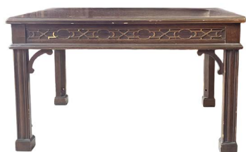
67 MESA AUXILIAR $ 2,500 - $ 4,000 MXN