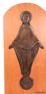
36 EFRÉN ORDOÑEZ (CHIH. 1927 – MTY. 2011) $ 1,800 - $ 3,200 MXN