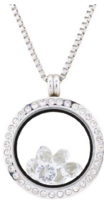
79 CADENA CON DIJE PIEDRAS FANTASÍA Salida en $ 1 peso