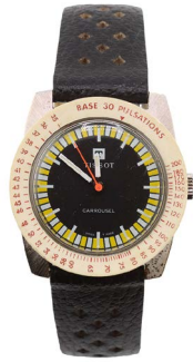
74 RELOJ MARCA TISSOT $ 4,000 - $ 6,500 MXN