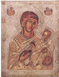
16 ICONO RUSO S. XX $ 1,500 - $ 2,500 MXN