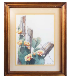
9 BLANCA BELDEN LARRALDE Salida en $ 1 peso