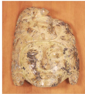
77 MÁSCARA PREHISPÁNICA Salida en $ 1 peso