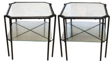
21 PAR DE MESAS LATERALES Salida en $ 1 peso