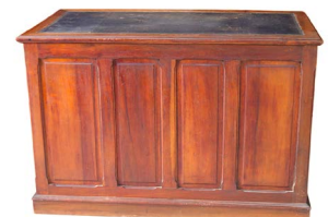
96 ESCRITORIO DE MESA ESTILO CLÁSICO Salida en $ 1 peso