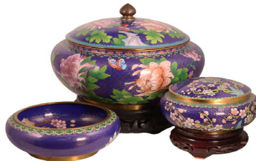
2 CENTROS DE MESA DE CLOISONNÉ Salida en $ 1 peso