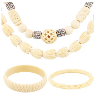
5 LOTE DE PIEZAS EN MARFIL Salida en $ 1 peso