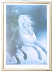
85 IMPRESIÓN CABALLO BLANCO Salida en $ 1 peso