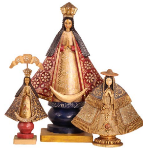
17 LOTE DE VIRGENES Salida en $ 1 peso