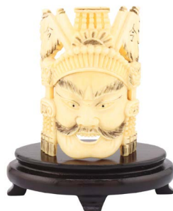
56 MÁSCARA DE MARFIL Salida en $ 1 peso