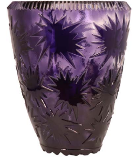
87 FLORERO DE CRISTAL Salida en $ 1 peso