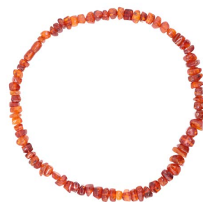
60 COLLAR DE ÁMBAR CHIAPANE- CO $ 2,500 - $ 3,500 MXN