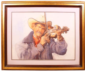
13 RETRATO DE VIOLINISTA Salida en $ 1 peso