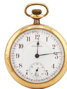
72 RELOJ MARCA BURLINGTON $ 4,000 - $ 7,000 MXN