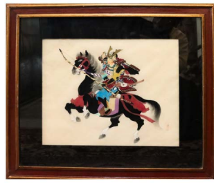
14 SAMURÁI A CABALLO $ 5,000 - $ 8,000 MXN