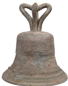
94 CAMPANA MEXICANA $ 2,500 - $ 5,000 MXN