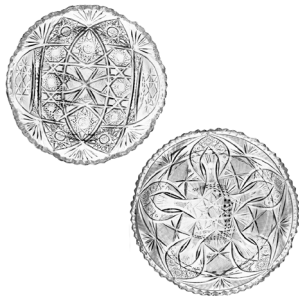
4 LOTE DE CRISTAL CORTADO Salida en $ 1 peso