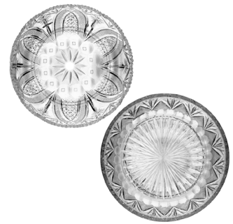
3 LOTE DE CRISTAL CORTADO Salida en $ 1 peso