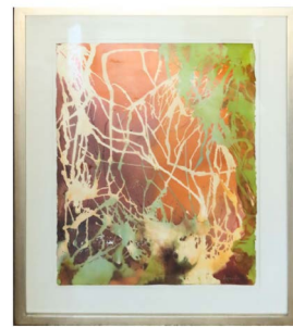
27 BLANCA BELDEN LARRALDE Salida en $ 1 peso