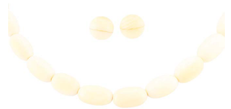
81 COLLAR Y ARETES EN MARFIL Salida en $ 1 peso