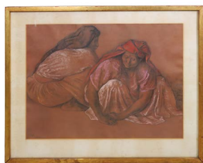
61 FRANCISCO ZÚÑIGA (COSTA RICA, 1912 - TALPLAN 1998) Salida en $ 1 peso