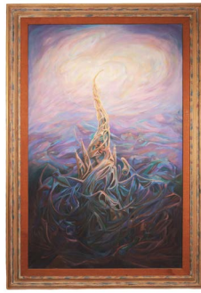
86 DAVID LEONARDO (MÉXICO SIGLO XX) Salida en $ 1 peso