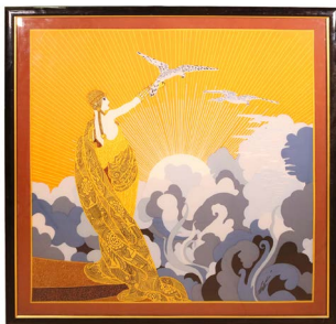
7 "ERTÉ" ROMAIN DE TIRTOFF (1892 - 1990) Salida en $ 1 peso