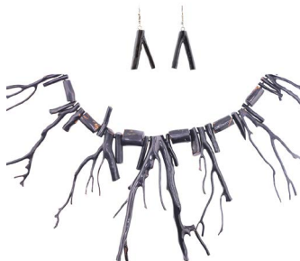
83 JUEGO EN CORAL NEGRO $ 3,000 - $ 6,000 MXN