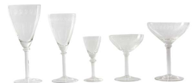
84 COPAS DE PEPITA $ 5,000 - $ 8,000 MXN