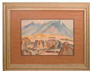
11 JAVIER SÁNCHEZ TREVIÑO (MTY 1940 - ) $ 3,000 - $ 5,000 MXN