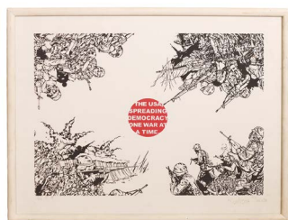
34 DANIEL RUANOVA (MEXICALI, BAJA CALIFORNIA, 1976) $ 3,000 - $ 5,000 MXN