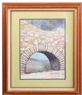
10 BLANCA BELDEN LARRALDE Salida en $ 1 peso