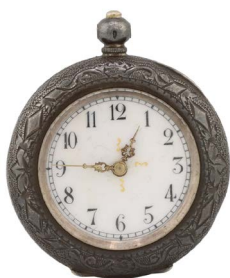
52 RELOJ DE BOLSILLO Salida en $ 1 peso