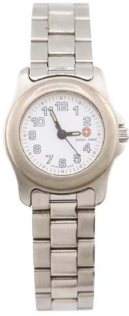
73 RELOJ SWISS ARMY Salida en $ 1 peso