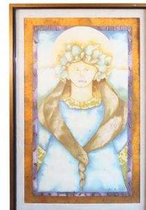
33 HEBER BANDA $ 3,000 - $ 5,000 MXN