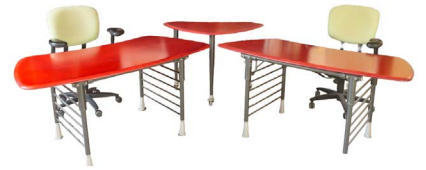
99 MESAS DE ESCRITORIO MODERNAS Salida en $ 1 peso