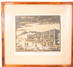
35 EFRÉN ORDOÑEZ (CHIH. 1927 – MTY. 2011) Salida en $ 1 peso