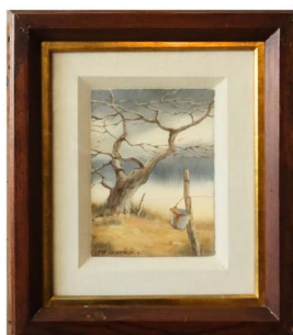
65 FERNANDO FUENTES (MONTE-RREY, NUEVO LEÓN 1953 - ) $ 3,000 - $ 5,500 MXN