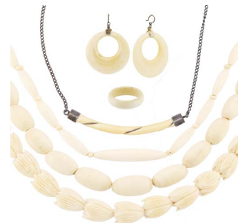
6 LOTE DE PIEZAS DE MARFIL Salida en $ 1 peso