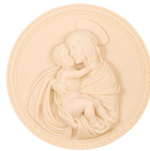
30 LA MADONNA DEL BOTTICELLI Salida en $ 1 peso