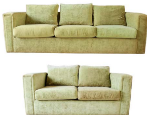
91 SALA MODERNA $ 6,000 - $ 10,000 MXN