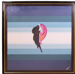
8 "ERTÉ" ROMAIN DE TIRTOFF (1892 - 1990) Salida en $ 1 peso