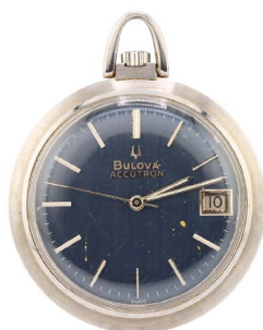
71 RELOJ MARCA BULOVA Salida en $ 1 peso