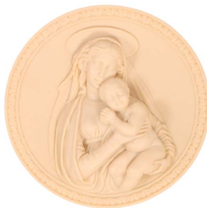
29 LA MADONA DEL DELLA ROB- BIA Salida en $ 1 peso