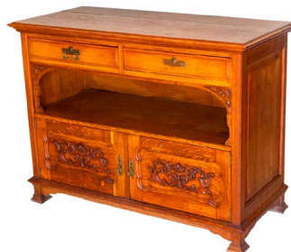
95 BUFETERO H. C THOMPSON Y CO. $ 2,500 - $ 4,000 MXN