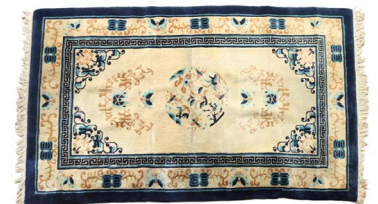
24 TAPETE CHINO $ 2,500 - $ 5,000 MXN