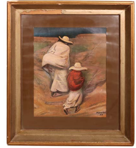
15 POSTER DE DAVID ALFARO SI- QUEIROS Salida en $ 1 peso