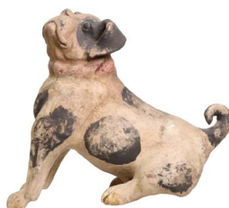
53 ALCANCÍA VINTAGE DE PERRO $ 10,000 - $ 13,000 MXN