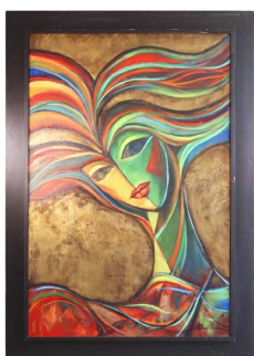
28 BLANCA BELDEN LARRALDE Salida en $ 1 peso