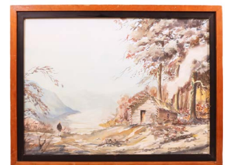
12 MIGUEL ARREDONDO $ 4,000 - $ 6,000 MXN