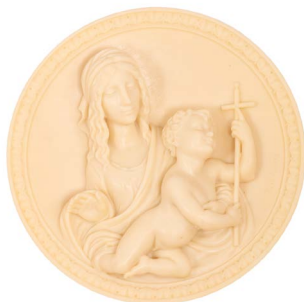
31 LA MADONNA DI LEONARDO Salida en $ 1 peso