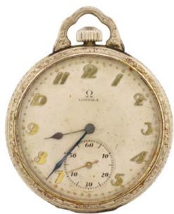
49 RELOJ MARCA OMEGA Salida en $ 1 peso