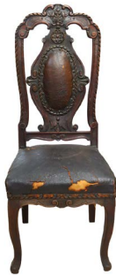
78 SILLA ANTIGUA Salida en $ 1 peso