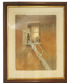
63 FERNANDO FUENTES (MONTE-RREY, NUEVO LEÓN 1953 - ) $ 7,000 - $ 10,000 MXN