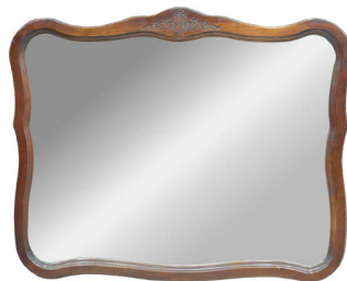
23 ESPEJO RÚSTICO Salida en $ 1 peso