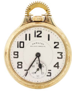
75 RELOJ MARCA HAMILTON $ 4,000 - $ 6,000 MXN