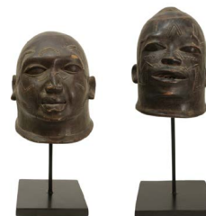
54 PAR DE MÁSCARAS MAKONDE TANZANIA $ 7,000 - $ 11,000 MXN