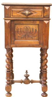
22 MESA LATERAL $ 3,500 - $ 5,500 MXN