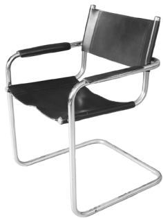
100 SILLA ESTILO MID CENTURY Salida en $ 1 peso