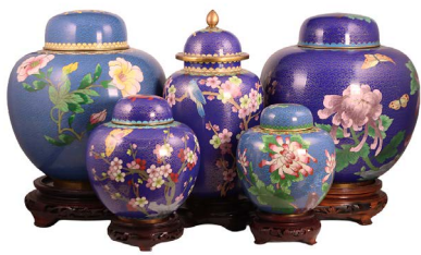
1 LOTE DE JARRONES CLOISONNÉ Salida en $ 1 peso