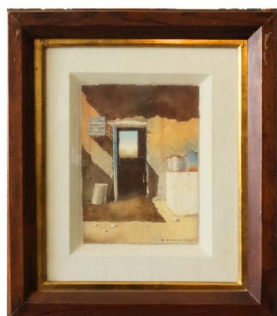
64 FERNANDO FUENTES (MONTE-RREY, NUEVO LEÓN 1953 - ) $ 3,000 - $ 5,500 MXN