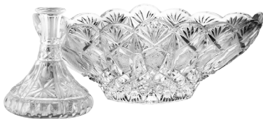
88 LOTE DE CRISTAL CORTADO Salida en $ 1 peso