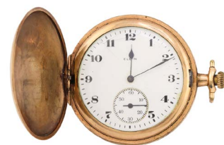
51 RELOJ MARCA ELGIN Salida en $ 1 peso