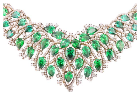
58 GARGANTILLA CON PIEDRAS SINTÉTICAS Salida en $ 1 peso