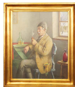
66 HOMBRE CON PIPA $ 5,000 - $ 7,000 MXN