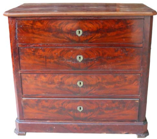
97 MUEBLE CÓMODA $ 4,000 - $ 6,000 MXN