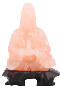
55 FIGURA ORIENTAL DE CUARZO ROSA Salida en $ 1 peso