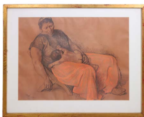
62 FRANCISCO ZÚÑIGA (COSTA RICA, 1912 - TALPLAN 1998) Salida en $ 1 peso