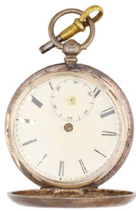
50 RELOJ DE BOLSILLO Salida en $ 1 peso