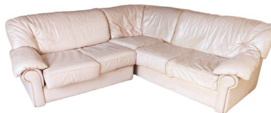
92 SALA DE PIEL ROSA Salida en $ 1 peso