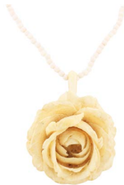
80 LOTE DE 2 COLLARES EN MAR- FIL Salida en $ 1 peso