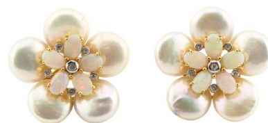
57 ARETES CON PERLAS $ 20,000 - $ 22,000 MXN