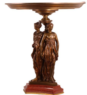
93 TAZZA ESTILO IMPERIO Salida en $ 1 peso