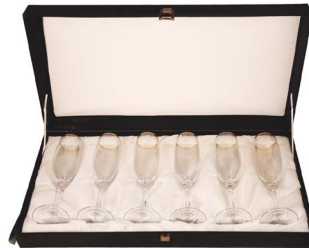
89 COPAS ITALIANAS Salida en $ 1 peso