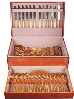
90 CUCHILLERIA YAMAZAKI Salida en $ 1 peso