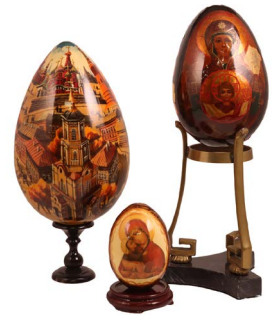
18 LOTE DE HUEVOS PEQUEÑOS Salida en $ 1 peso