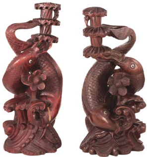
19 PAR DE ESCULTURAS $ 4,000 - $ 6,000 MXN