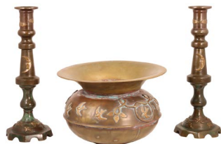
70 LOTE DE BRONCE $ 4,500 - $ 6,000 MXN