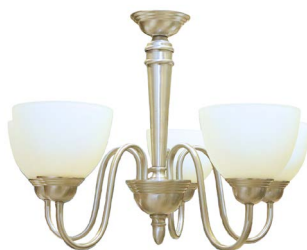
68 CANDIL MODERNISTA DE 5 LUCES $ 2,500 - $ 4,500 MXN