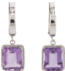
82 HUGGIES CON AMATISTAS $ 4,000 - $ 6,000 MXN