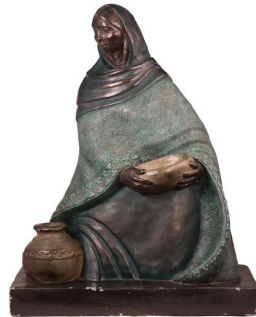
20 ESCULTURA MUJER INDIGENA Salida en $ 1 peso