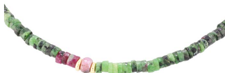
59 GARGANTILLA DE ESMERAL- DAS Y RUBÍES $ 1,500 - $ 2,200 MXN