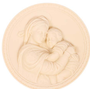
32 LA MADONNA DI RAFFAELLO Salida en $ 1 peso