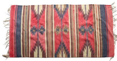
26 ALFOMBRA KILIM TRIBAL $ 1,800 - $ 3,000 MXN